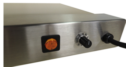
Bovenwarmte is met een dimmer regelbaar